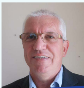
Joël BONNAFFOUX Maire de LA BÂTIE-NEUVE