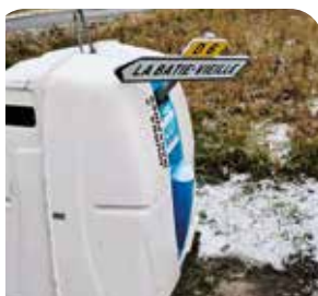
UN PANNEAU ROUTIER... DANS LES PAPIERS ?