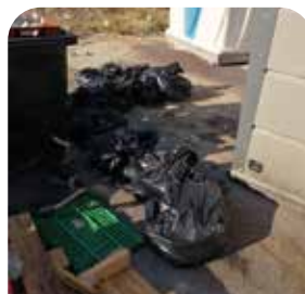
DES SACS D'ORDURES EN VRAC AU SOL...

Des meubles, des pneus, des poutres, des micro-ondes, des morceaux d'animaux découpés en période de chasse, de l'huile de vidange vidée dans la benne des papiers ou des emballages... Les idées ne manquent pas ! Un véritable manque de civisme. Pour rappel, vous pouvez encourir jusqu'à 15 000 € d'amende* (loi du 10 février 2020) et la confiscation du véhicule ayant servi au transport des déchets sauvages.