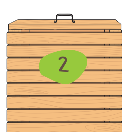
Réserve de déchets secs